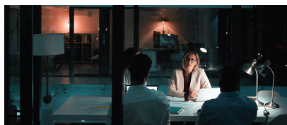
Des employés en assurances évaluent les réclamations 25 % plus rapidement à l'aide de Watson.