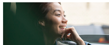
Bureau en gros révolutionne le service à la clientèle avec leur bouton « Easy ».

« Le temps est venu d'exploiter l'informatique cognitive. Dans l'ère du numérique, les organisations d'un marché ne se font pas seulement concurrence les unes aux autres, elles doivent aussi entrer en compétition avec l'innovation.