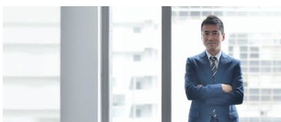
Avec Watson, KPMG stimule l'innovation et donne le contrôle à ses employés.